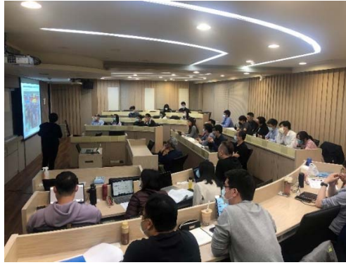
圖 2 分組報告示意圖

本課程作業皆為開放式的探討，其中一項作業為個人 SWOT 分析，老師希望透過此作業，讓同學能夠以專業的角度進行自我分析，使同學能夠透過作業更加瞭解自身價值。圖 3 為作業討論示意圖。