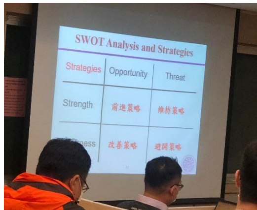
圖 3 作業討論示意圖

本課程作業皆為開放式的探討，其中一項作業為個人 SWOT 分析，老師希望透過此作業，讓同學能夠以專業的角度進行自我分析，使同學能夠透過作業更加瞭解自身價值。圖 3 為作業討論示意圖。