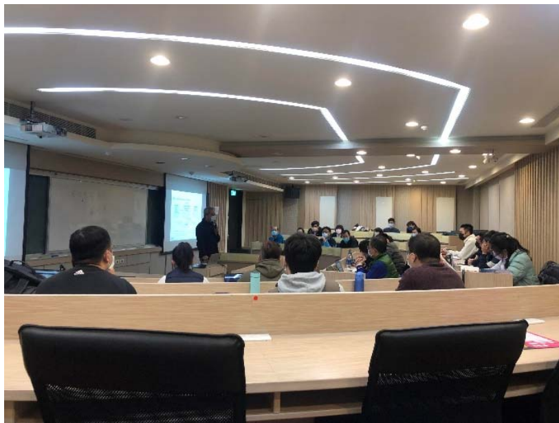
圖 1 實體授課示意圖

本課程老師如同美式教育，以互動式的教學模式進行授課，老師會於每次上課探討生管相關問題，並依序點名同學回答問題，且許多問題為開放式答案，同學能夠表達自身想法，老師也會靈機應對所有學生的想法，除了生產與營運管理相關知識的養成，學生也能夠透過此課程訓練自己獨立思考、自我表達與靈機應變的能力。圖 1 為實體授課示意圖。